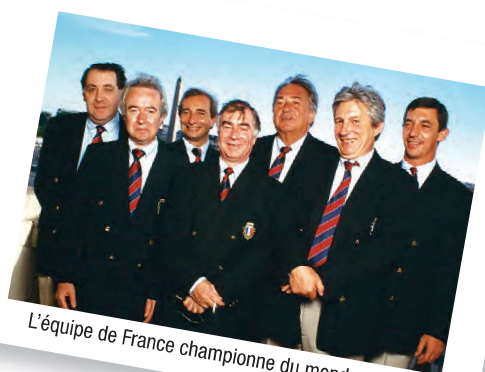
L'équipe de France championne du monde en 1997.

Mouiel est rentré en main par le Roi de Cœur et a donné un Pique à Ouest. Celui-ci a rejoué Trèfle. Mari a pris de l'As et rejoué un petit Trèfle sur lequel Mouiel... a défaussé un Carreau. 4 Cœurs faits. Une belle joute entre champions.